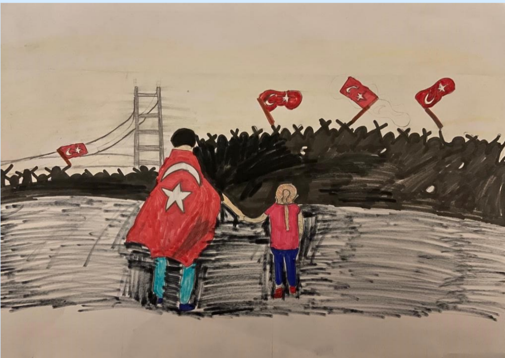
Maşallah AYSAN 4/F