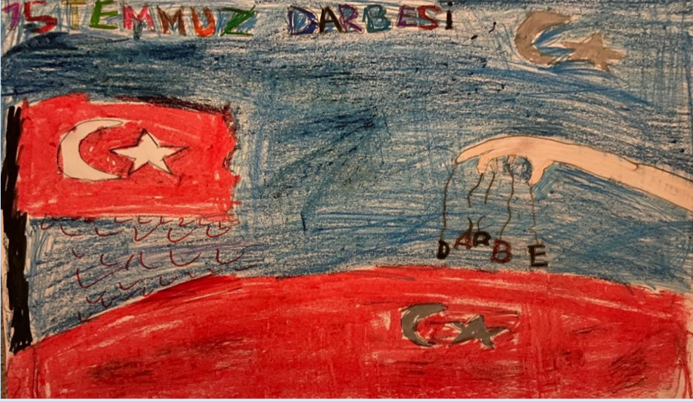
Mercan GİDER 4/F